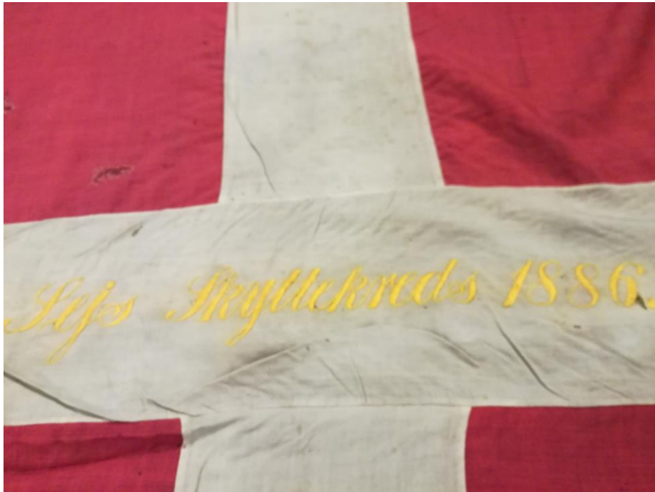
Den første fane fra 1886

Foreningen startede i 1884. Det fremgår af et dokument fra 25. november 1884, hvor skyttekredsen blev godkendt på et udvalgsmøde i Århus. Vores forening er således Sejs-Svejbæks ældste forening. Allerede i 1885 deltog den i en årlig skyttefest, og i oktober 1885 blev der holdt præmieskydning i Sejs. I 1886 fik foreningen en fane, der stadig er i vores varetægt. "Sejs Skyttekreds 1886" står der med guldbogstaver på den ene side og "Sønderjylland vundet". Det er kampens mål" på den anden. Tabet af Slesvig-Holsten i krigen 1863-64 stod stadig i frisk erindring.